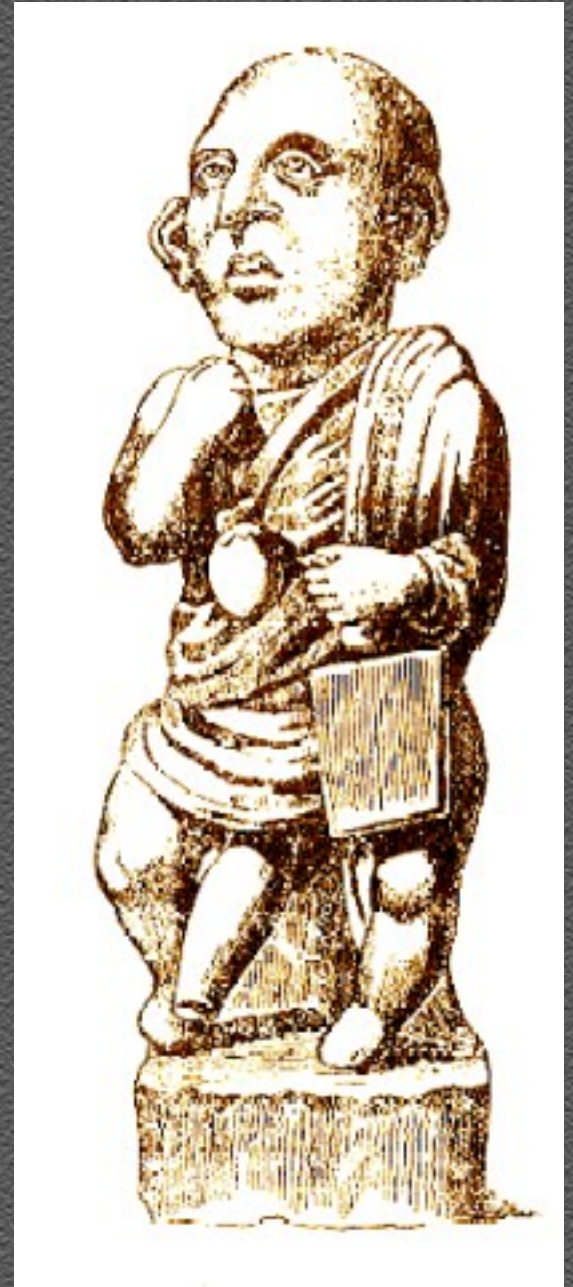
Figurilla romana de barro cocido de la época de El Satiricón.

(10) En el texto, «schedium», del griego: «hecho rápidamente».